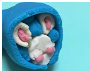
③パーツを組み 合わせる