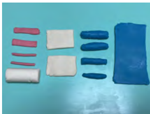
①顔 耳 目などの パーツを作る