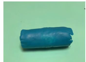
④つぶさないように転が してのばし、切る